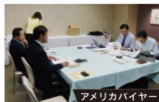
アメリカバイヤー

秋田県貿易促進協会は 県経済のグローバル化に対応するため、 平成16年5月19日社団法人として設立、 平成21年8月から一般社団法人として 活動しています。