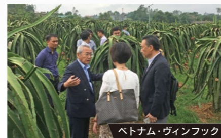
ベトナム・ヴィンフック