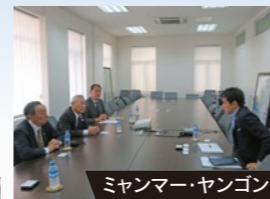
ミャンマー・ヤンゴン