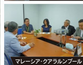
マレーシア・クアラルンプール