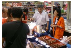
伊勢丹シンガポール東北フェア

期 間 平成25年11月29日～12月9日 会 場 伊勢丹シンガポール スコッツ店 出展商品 日本酒、稲庭うどん、りんご、ぶどうジュース、かりんとうまんじゅう等 28品目