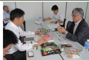
シンガポールバイヤー招聘

期 間 平成25年9月4日 訪問先 稲庭うどんの生産工程、加工施設視察 商談会参加 企業6社 商談品目 稲庭うどん、お菓子類、ぶどうジュース、清酒、米、りんご 等