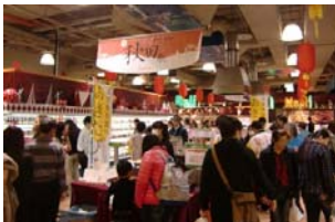
台湾微風広場での販促活動

期 間 平成26年1月31日～2月9日 会 場 百貨店「微風広場」 出展商品 米、りんご、きりたんぼ、稲庭うどん、味噌、醤油等 33品目