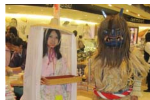
香港スーパーでの農産物販促活動

期 間 平成25年9月6日～8日 会 場 香港スーパーマーケット2店舗（ジャスコ、グレイト） 出展商品 米、枝豆、メロン、桃、梨