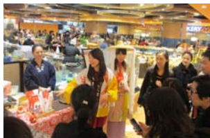
香港スーパーでの県産米販促活動

期 間 平成25年12月13日～15日 会 場 香港スーパーマーケット2店舗（ジャスコ、テイスト） 出展商品 米（あきたこまち）